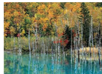
白金青い池 Shirogane Blue Pond