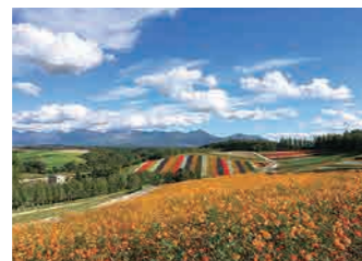
四季彩の丘 Shikisai-no-Oka Panoramic Flower Gardens