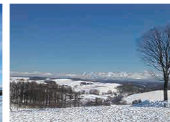
四季彩の丘 Shikisai-no-Oka Panoramic Flower Gardens