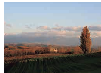
ケンとメリーの木 Tree of Ken & Mary

When the Tokachi-dake mountain range is blanketed in pure white snow, winter's messengers gather in the foothills.