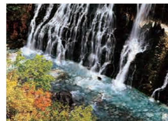
白ひげの滝 Shirahige-no-Taki Falls