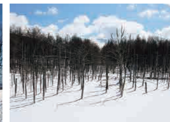
白金青い池 Shirogane Blue Pond