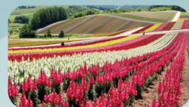
四季彩の丘 Shikisai-no-Oka Panoramic Flower Gardens

Colloidal particles made by Shirahige-no-Taki Falls when its water mix in Biei river scatters sunlight and cause the water looks blue.